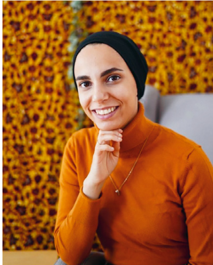
Eşim Karakuyu