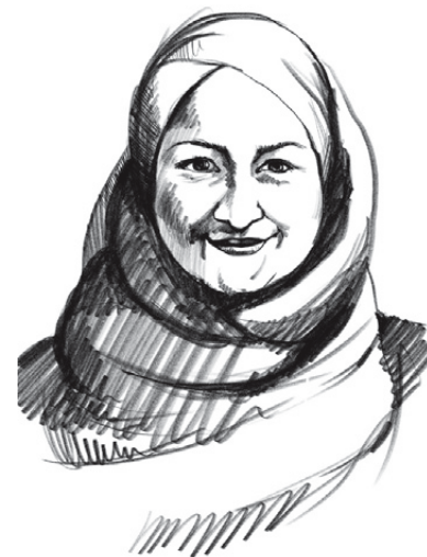
Illustration: Petja Dimitrova

Keine gefärbten Haare, kein gepiercetes Ohrloch dieser Welt, haben Kinderseelen aber so zerstört oder in ein tiefes Loch der Gefühle getrieben, wie die Art und Weise wie Kinder und Jugendliche aufgrund ihres Migrationshintergrundes politisch vorgeführt werden. Nun ja, das hinterlässt sehr wohl Spuren – und die sind nicht klein. Wenn Vertreter:innen unseres Landes Klassenlisten öffentlich laut vorlesen, um darauf aufmerksam zu machen, dass so und so viele Kinder nicht österreichische Namen haben, dann läuft in unserem Land gewaltig etwas schief. Das Datenschutzgesetz und die Würde dieser Menschen wurden hier mit Füßen getreten. Wichtig ist die Frage: Wie sind wir überhaupt dort hingekommen?