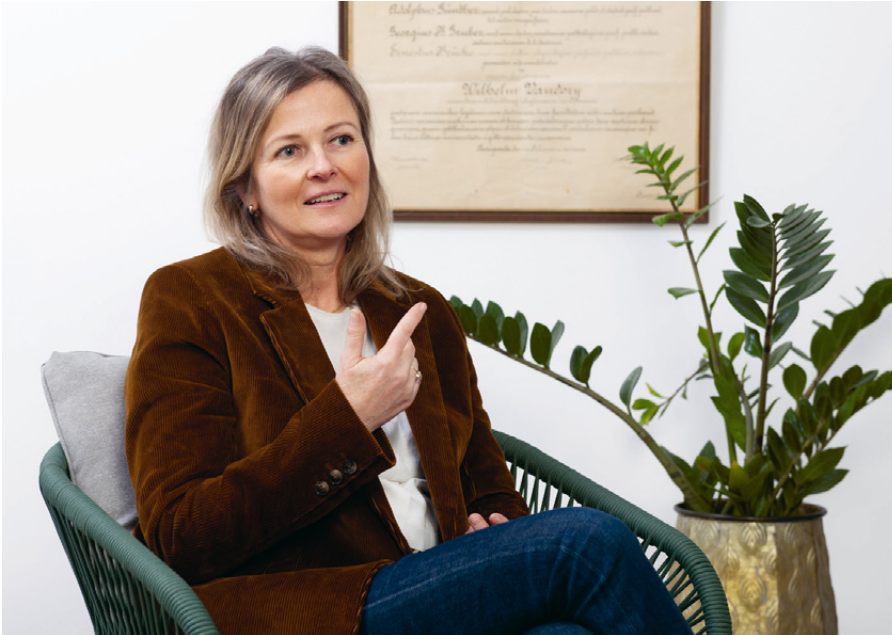
Ungewissheit wirkt sich gesamtgesellschaftlich aus. So kehrten etwa laut einer US-Studie während der Coronakrise Männer und Frauen zu traditionellen Rollenbildern zurück, berichtet die Psychologin.

kleinste System ist das familiäre Umfeld und der Freundeskreis und das allergrößte System die Gesellschaft mit Politik und Kultur. Wenn in großen Systemen viele Unsicherheiten herrschen, dann brauche ich zumindest im kleinen System einen sicheren Hafen. In der Coronakrise war das zum Beispiel mein soziales Umfeld, das mir Kraft gegeben hat.