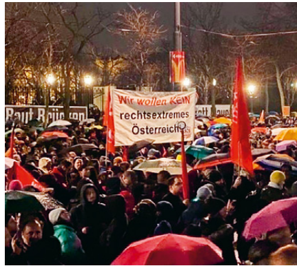
Großkundgebung in Wien gegen die rechtsextreme Gefahr

Die Situation in Österreich ist noch dramatischer als in Deutschland. Hierzulande führt mit der FPÖ eine Partei in Umfragen, die Rechtsextremisten aktiv finanziell fördert, Zusammenkünfte von Rechtsextremisten mitorganisiert, rassistische Pläne verteidigt und bis in die Spitzenriege hinein selbst rechtsextrem durchgesetzt ist. Und während in unserem Nachbarland die politische Brandmauer gegen Rechtsextremismus bislang noch weitestgehend intakt ist und sich auch