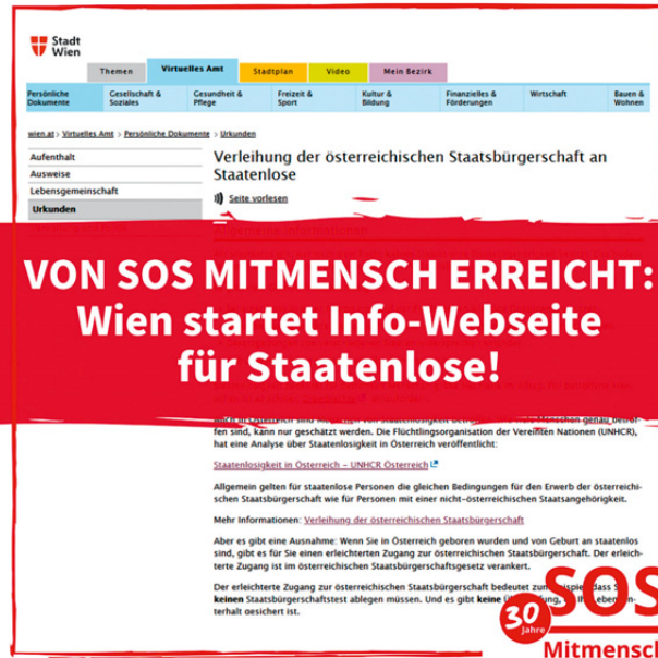
Stadt Wien informiert Staatenlose über ihre Rechte