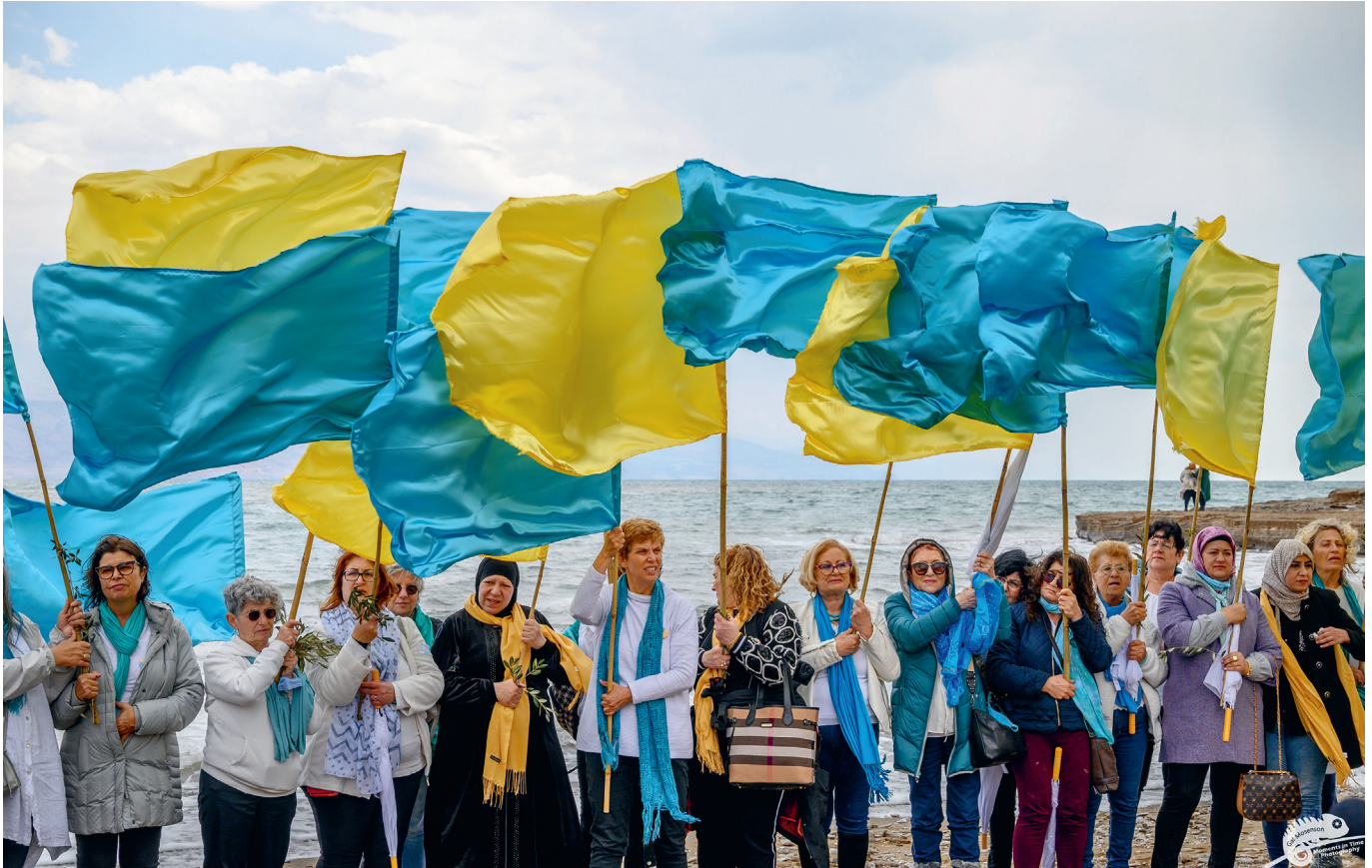
Im März 2022 trafen sich hunderte israelische und palästinensische Frauen der Organisationen „Women Wage Peace“ und „Women of the Sun“ am Toten Meer, um dauerhaften Frieden, Freiheit und Sicherheit für alle zu fordern.