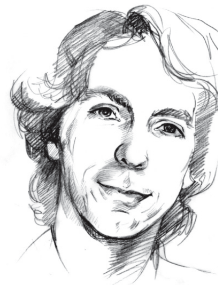
Illustration: Petja Dimitrova

Was ist zu tun? Zuallererst die Situati-