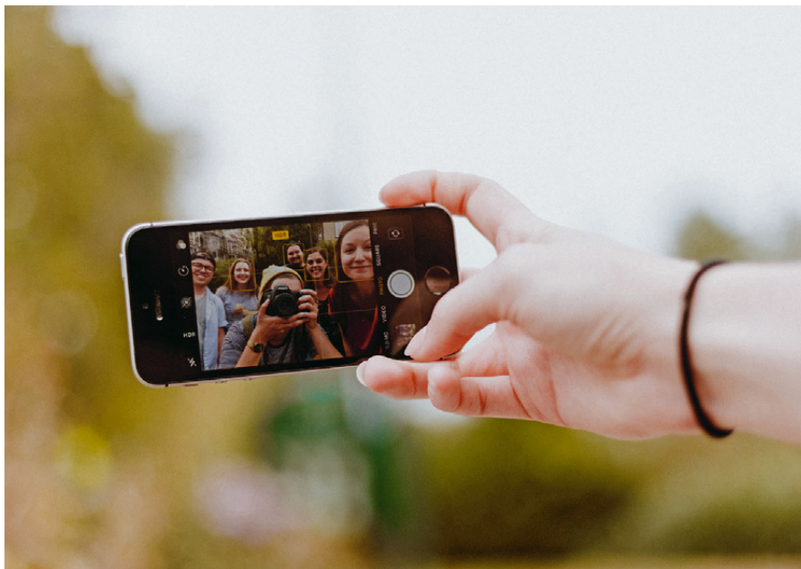
Viele junge Menschen sorgen sich nicht nur um ihre persönliche Zukunft, sondern auch um das Weltgeschehen, die Umwelt und das Klima.