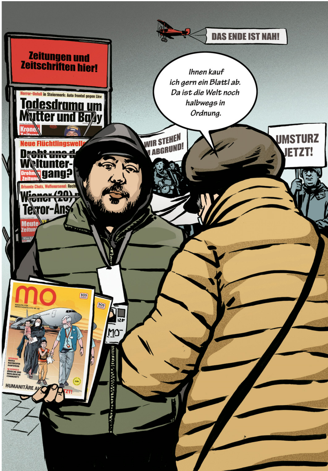
Illustration: P.M. Hoffmann, Text: Thyra Veyder-Malberg