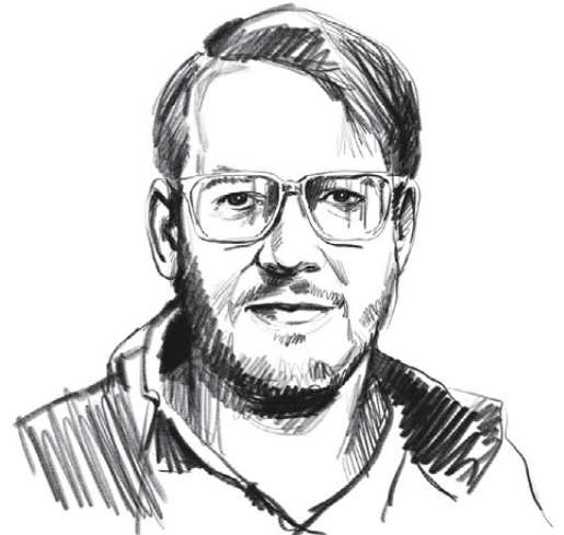
Illustration: Petja Dimitrova

G roße Aufregung im Boulevard-Blätterwald zu Weihnachten: Jugendliche Geflüchtete haben in einer Unterkunft mehrfach einen Feuer-Fehlalarm ausgelöst. Einige Male musste daher die Freiwillige Feuerwehr Steyregg umsonst ausrücken. Als dann doch ein Müllcontainer vor dem Haus brannte, haben einige Jugendliche die anrückende Feuerwehr behindert, einige Feuerwehrfrauen fühlten sich aufgrund des Verhaltens der Jugendlichen unwohl. In der Presseaussendung der Feuerwehr war der Unmut greifbar. Die Krone titelte „Unfassbar!“, die Volksseele kochte. Rufe nach Abschiebung wurden laut.