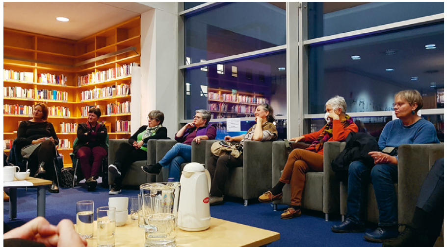
Themen, über die jede:r etwas zu erzählen hat, gibt es viele: Abschiede, Ankommen, Essen und Trinken, Feiertage, Geschenke, Kostüme, Neuanfänge und viele mehr.

„Auch die Erfahrungen in der NS-Zeit waren zunehmend Thema“, berichtet Gert Dressel. In einem Gesprächskreis in einem Senior:innen-Wohnheim in Ottakring waren etwa – wie sich im Lauf der Gespräche herausstellte – sowohl Jüdinnen, die die NS-Zeit überlebt hatten, als auch ehemals engagierte Nationalsozialistinnen. Mit der Zeit sprachen alle über ihre Erfahrungen in der NS-Zeit. Eine Teilnehmerin, deren Mann im Konzentrationslager Dachau ermordet wurde, sagte danach: „Ich